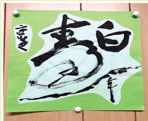
◀ご利用様が趣味とされている習字の作品の一つです。今後、元気になられたら継続して励んでいきたいと考えていらっしゃいます。

A 手すりを使うことにより精神的にも安心して起き上がることができました。そ(〇様)の為、積極的に起き上がって屋内を自分の足で歩き回ることがリハビリになり、早期回復することができました。またリハビリに対する意欲が湧き、歩くことの楽しさや生きがいを感じています。できるだけ自分のことは自分でやりたい性分なので1日でも早く自分の足で歩けるよう、自宅内でも手すりを使って屈伸運動などを行いました。L字型の特性を活かしてリハビリ器具代わりに使えるのもこの手すりの魅力の一つだと感じました。昔は絵を描いたり生け花をするのが好きで、最近ではデイサービス等の活動で習字を書いたりすることがあります。身体の具合もだいぶよくなりましたのでそのようなことにも励んでおります。